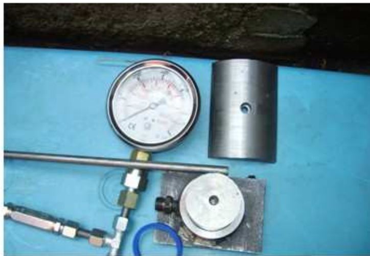
Slika 1. – Mema sonda MS-IRM 2

Ova oprema je domaće proizvodnje, izrađena od domaćih materijala u IRM-u. Može se primenjivati u bušotinama na površinskim kopovima, jamama i tunelogradnji. U zavisnosti od potrebe može se serijski proizvoditi različitih prečnika. Cena uređaja zavisi od njegovih dimenzija i višestruko je manja od cene istih inostranih uređaja.