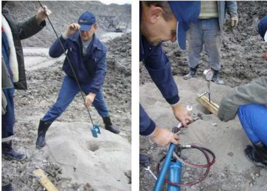
Slika 4. – Prikaz testiranja rada meme sonde MS-IRM 2 na PK „Banovići“

Sonda je testirana u laboratorijama Instituta za rudarstvo i metalurgiju iz Bora kao i na PK „Banovići“ u Republici Srpskoj BiH i pokazala je veoma precizne rezultate merenja.